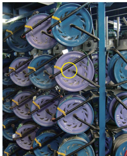
整理整頓されたコードリールの専用棚