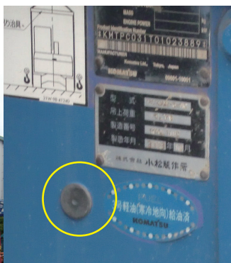
大型建機は製造プレートと共に ICタグで管理