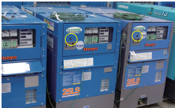
ICタグを読み取りしやすく 並べられた大型発電機