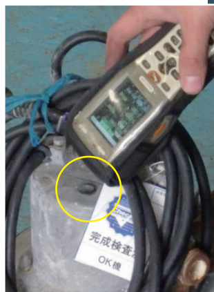
指示伝票と付け合わせ、 ICタグの読み取り作業