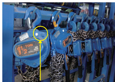
ICタグが一目で分かるようホワイトに色塗り