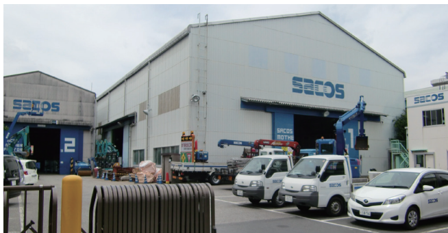
サコス株式会社 市川営業所