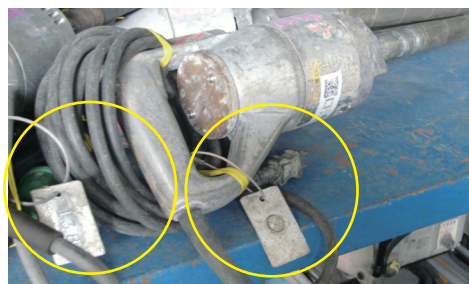
金属プレートに埋込まれたICタグ(裏には管理番号を刻印)