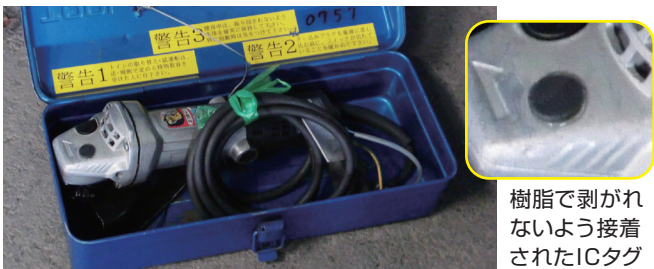
樹脂で剥がれないよう接着されたICタグ