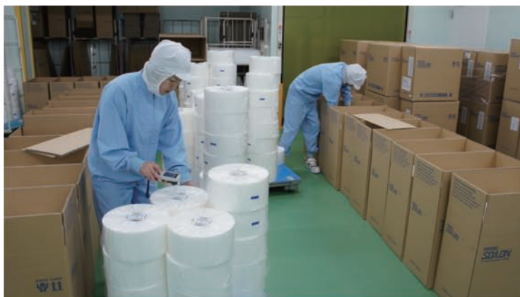
出荷検品・梱包作業

しかし製品の種類と生産数、 出荷先が非常に多いため、旧システムではバーコードの読み取りだけでも膨大な工数がかかっていた 。また現場からも「大変だ」「改善して欲しい」という声が上がっていて、変えるきっかけを待っていました。ちょうど2016年頃には基幹システムが老朽化して更新時期に来ていたので、 この機会に新しいことへチャレンジしようということに決めました。