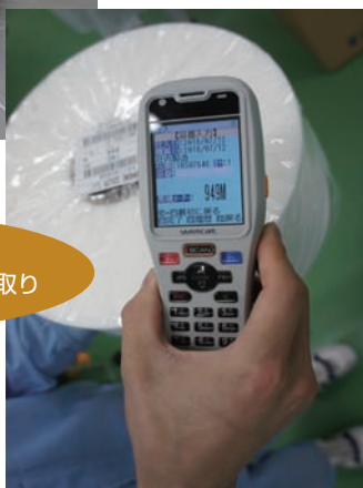
マルチスキャン機能で複数バーコードを一括読み取り