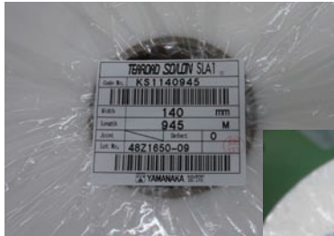
「商品コード」「ロットコード」の2段バーコードで管理