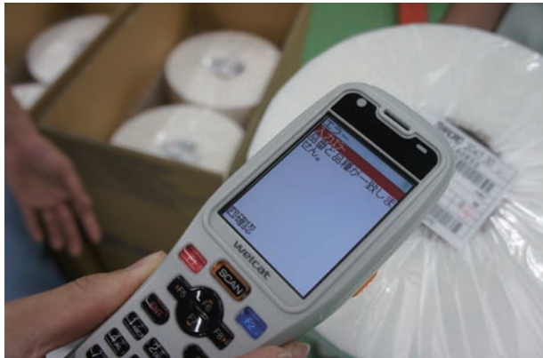
エラーチェック機能で2重読み取りなどのミスを防止