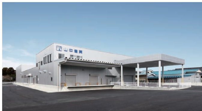
山中産業株式会社 能登工場