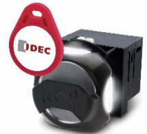
■ KW2D形 ø22 スマート RFIDリーダ