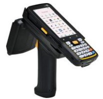
■ Android™搭載バーコードハンディターミナル/RFIDリーダライタ