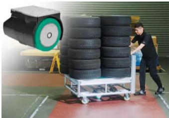
■ アシストホイールドライブ