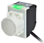
■ 1A1M形マルチユース ミリ波レーダセンサ