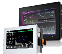
■ FT1J/2J形 プログラマブル表示器 一体型コントローラ