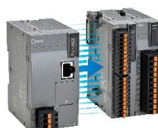
■ SX8R形 バス拡張モジュール (リモートI/O)