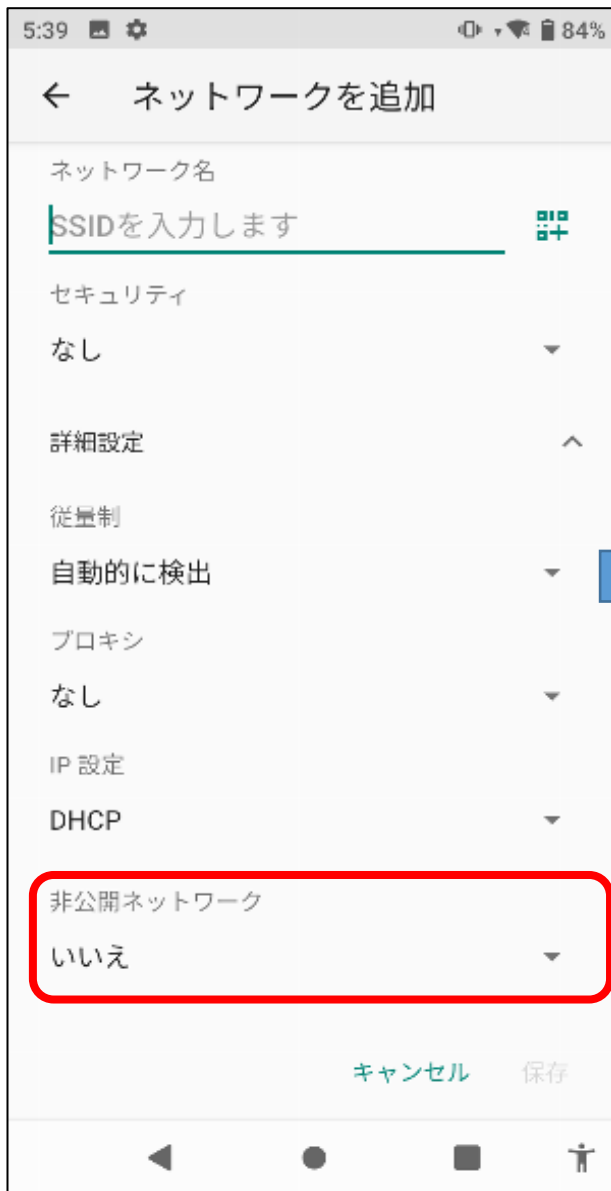
「非公開ネットワーク」を確認